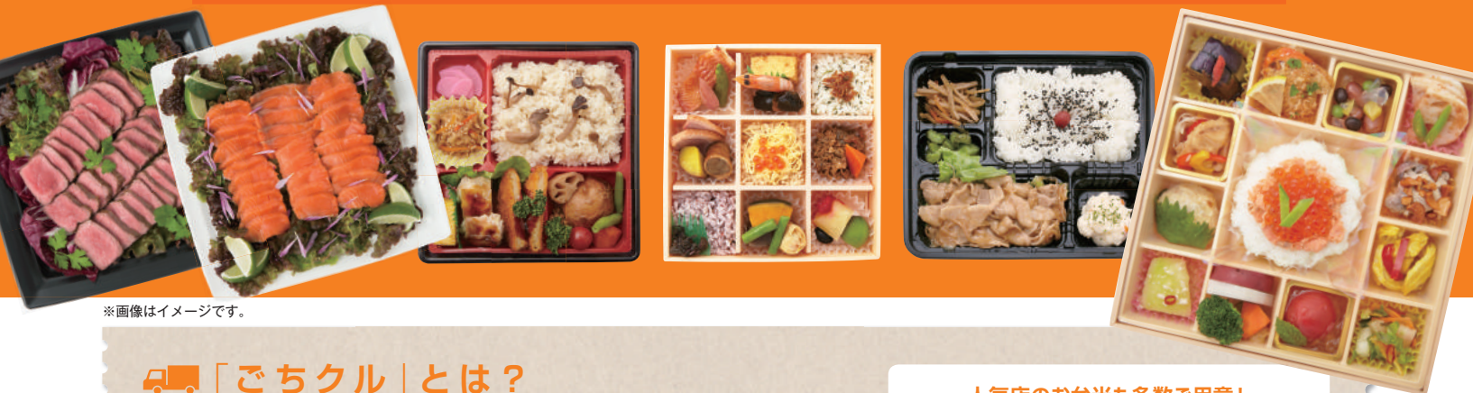
※画像はイメージです。